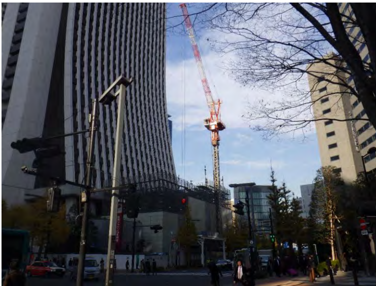
南側(コクーンタワー側)から撮影

工事は、2020年5月の開館に向けて予定通り進捗しています。 現在、3階～4階の躯体工事を行っています。