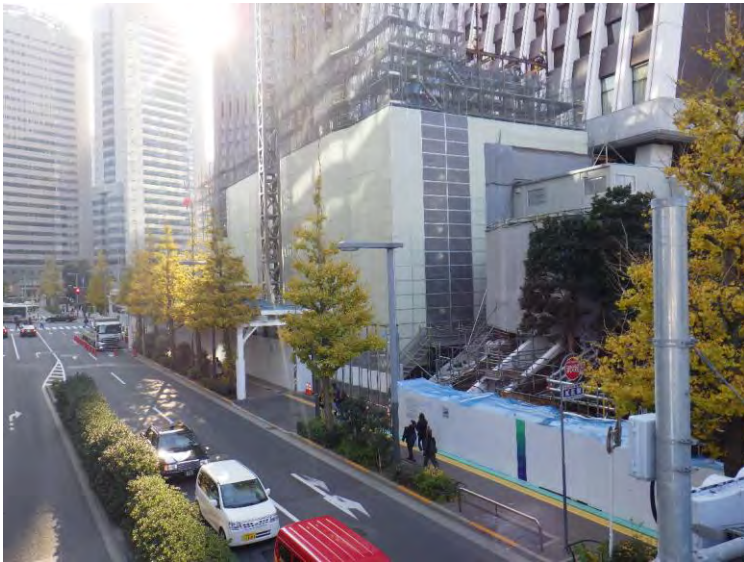
北側(青梅街道側)から撮影