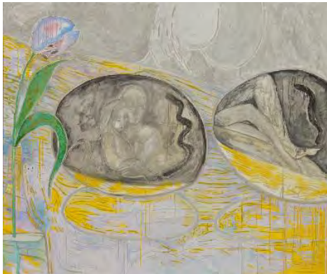
谷崎桃子(たにざき ももこ) 《Lovers and object as outsiders in the bedroom》2018年 アクリル・油彩・キャンバス 162×194cm (審査員：堀元彰)