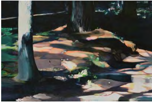
奥田文子(おくだ あやこ) 《untitled》2018年 油彩・綿キャンバス 130.3×194cm