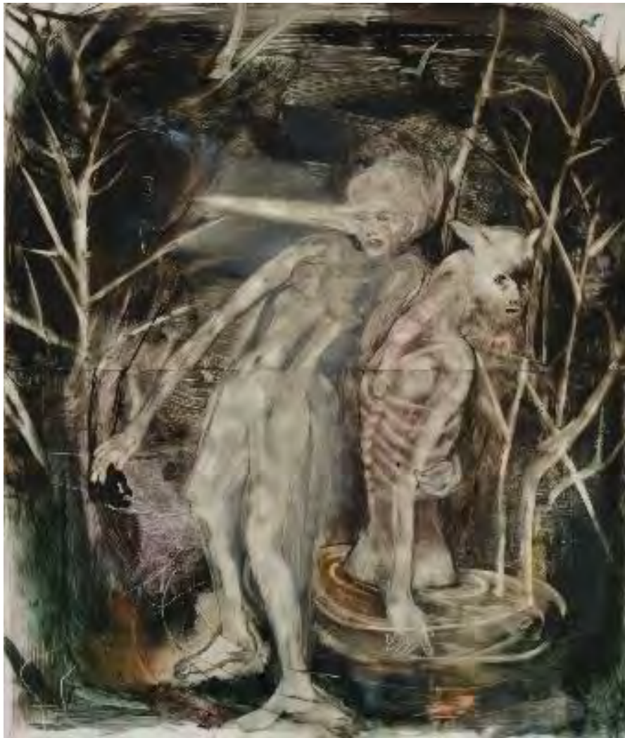
グランプリ受賞作

上記の審査会を11月19日（月）に行い、入選作品71点、 グランプリを含む受賞作品9点を決定いたしました。