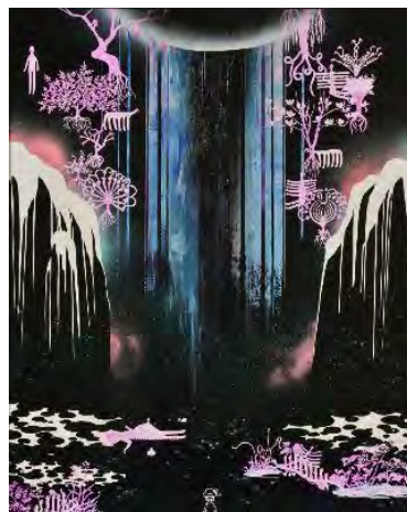
桶本理麗(おけもと りり) 《滝》2018年 ミクストメディア・パネル 162×130.3cm (審査員：山村仁志)