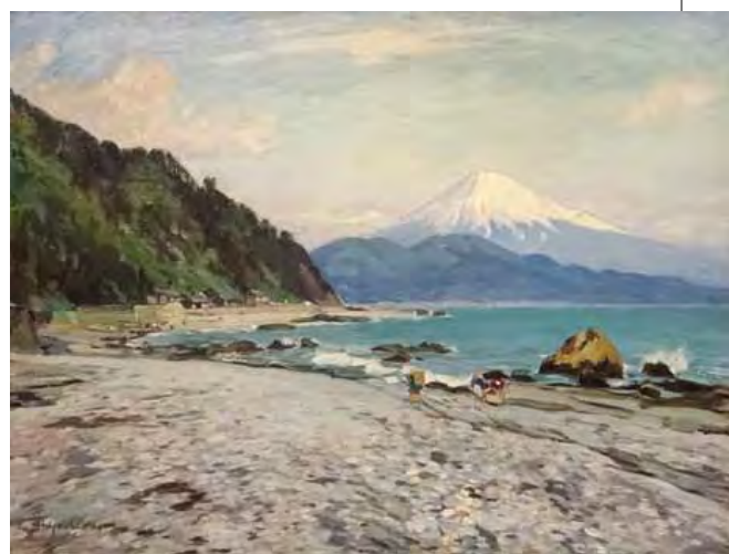
吉田 博《興津の富士》1920年代 油彩・キャンバス、61.0×80.5cm、寄託

現場制作したか、同地を取材したスケッチに基づき描いた可能性から本油彩画の制作年が推測されます。なお、本作に見える海岸沿いには、現在、戦後開通した東名高速道路やバイパスの続く風景が広がっています。