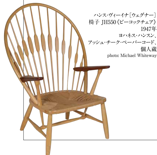
ハンス・ヴィーイナ[ウェグナー] 椅子 JH550(ピーコックチェア) 1947年 ヨハネス・ハンズン、アッシュ・チーク・ペーパーコード、個人蔵

デンマークは、近年人気を集める北欧デザインの中でも、巨匠を輩出し続けるデザイン大国です。1950年代から60年代のデザイン史上の黄金期に、ハンス・ヴィーイナ(ウェグナー)、アーネ・ヤコプソン(アルネ・ヤコブセン)、フィン・ユール等のデザイナーたちが、多くの優品を創り出しました。それらのシンプルで美しいデザインは、現代までのデンマーク・デザインの特質をなしています。そこには、誰もが良質で快適な住まいを持つことを推奨してきた、福祉国家としての姿勢が伺えます。