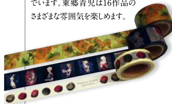
マスクングテープ 3種 大600円 小550円

ゴッホ《ひまわり》、セザンヌ《りんごとナブキン》、東郷青児作品をマスクングテープにしました。《ひまわり》は部分をアップで使用し迫力の仕上がりに! 《りんごとナブキン》からはりんごをひとつずつ取り出しました。ころころとかわいらしく並んでいます。東郷青児は16作品のさまざまな雰囲気を楽しめます。