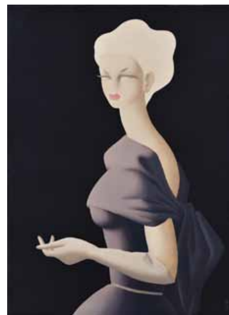
《バイオレット》1952年 油彩、キャンヴァス 108.4×80cm 損保ジャパン日本興亜

【展覧会データ】 展覧会名 | 生誕120年 東郷青児展 抒情と美のひみつ 会期 | 2017年9月16日(土)～11月12日(日) 主催 | 東郷青児記念 損保ジャパン日本興亜美術館 産経新聞社、テレビ朝日 協賛 | 損保ジャパン日本興亜、みずほ銀行 後援 | 公益社団法人二科会、新宿区教育委員会