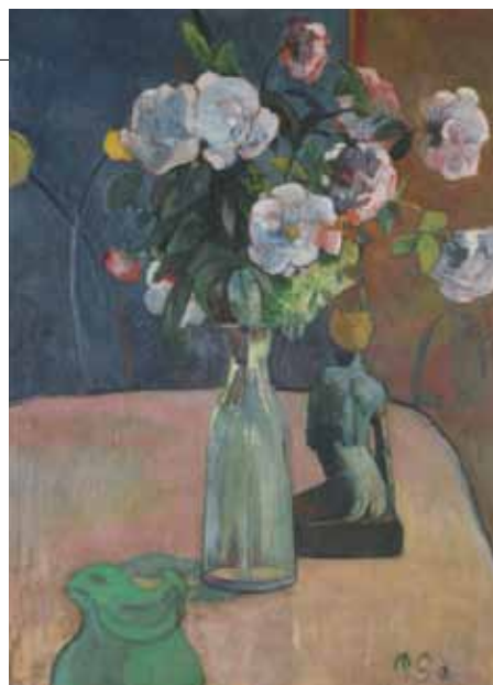
ポール・ゴーギャン《バラと影》1889年 油彩・キャンバス Reims, Musée des Beaux-Arts

展覧会名 | 生誕140年 吉田博展 山と水の風景 会 期 | 2017年7月8日(土)～8月27日(日) 主 催 | 東郷青児記念 損保ジャパン日本興亜美術館 毎日新聞社 協 賛 | 損保ジャパン日本興亜、ニューカラー写真印刷 特別協力 | 福岡市美術館 協 力 | モンベル