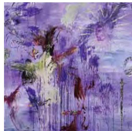
室井公美子《Anima》 2016年 油彩・キャンヴァス、227×227cm

【展覧会データ】 展覧会名 | クインテットIV—五つ星の作家たち 会期 | 2018年1月13日(土)～2月18日(日) 主催 | 東郷青児記念 損保ジャパン日本興亜美術館 朝日新聞社 協賛 | 損保ジャパン日本興亜