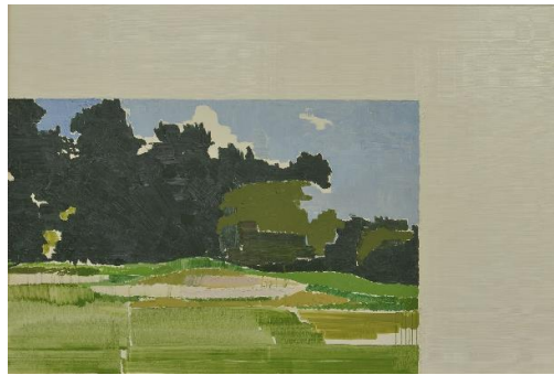
宮岡 俊夫 (みやおか としお) 《Landscape》2016年 油彩・キャンバス 132.7×196.2 cm 1984年生まれ