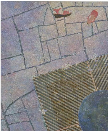
片野 莉乃 (かたの りの) 《swimmer》2016年 岩絵具・胡粉・箔・雲肌麻紙 200×168 cm 1992年生まれ (審査員：本江邦夫)