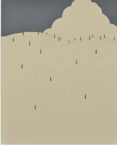
杉田 悠介 (すぎた ゆうすけ) 《山》2016年 アクリル・パネル 162×130 cm 1982年生まれ